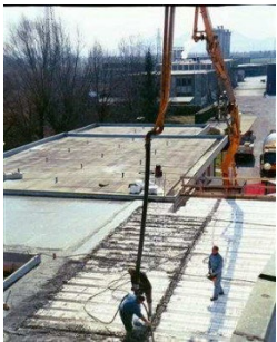
Longueur finale en application